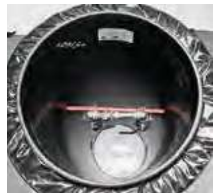
Innenraum des Schachtes STANDARD