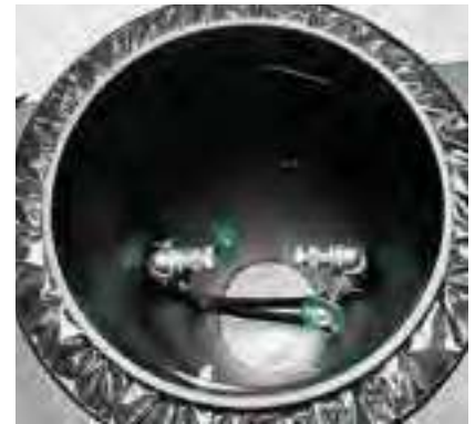
Innenraum des Schachtes PREMIUM